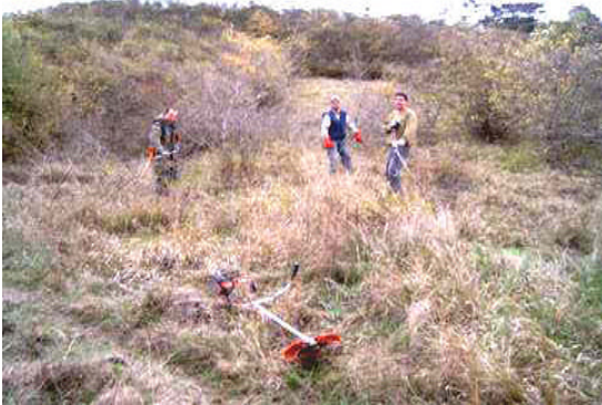
Mitglieder beim Arbeitseinsatz auf dem Eckerich

Wir wollen auch künftigen Generationen das „Wunder Natur“ erlebbar machen und sie für die Belange der Natur sensibilisieren.