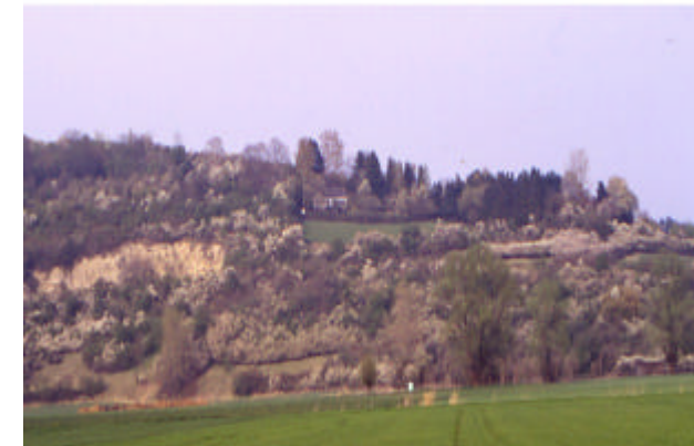
Blick aus der Ederau auf den Eckerich

Der Eckerich befindet sich im Schwalm-Eder-Kreis zwischen der Stadt Fritzlar und dem Stadtteil Geismar auf einer Höhe von 180—258 m über NN.