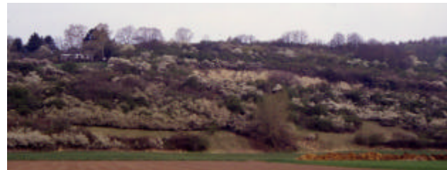
Blick aus der Ederaue auf den Eckerich

Besonders artenreich sind Wiesenstandorte auf Kalk und Basalt wie hier am Eckerich. Werden diese Biotope nicht gepflegt, schreitet die Sukzession sehr schnell voran.